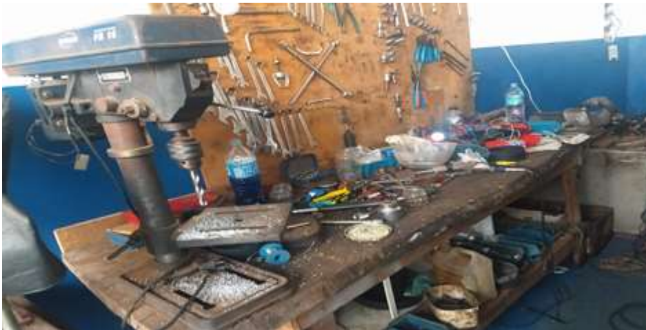
Figura 6 - Bancada de ferramentas antes do Programa 5S