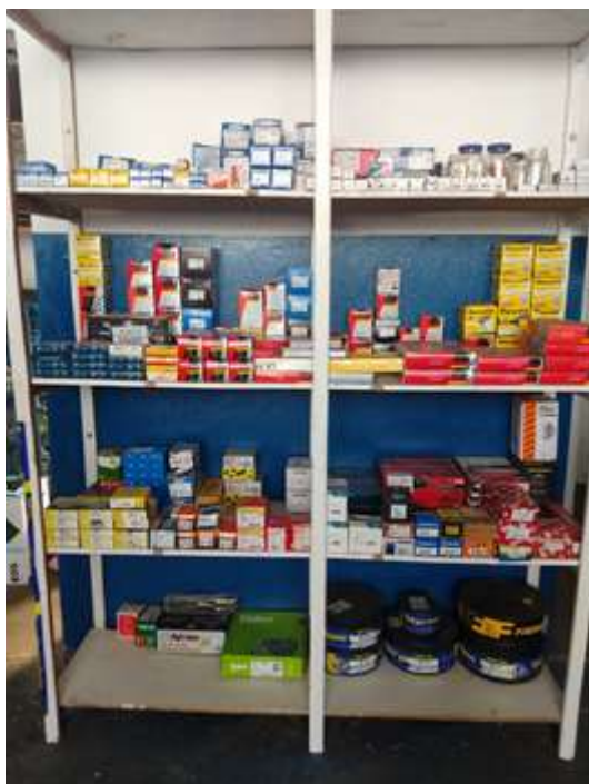
Figura 7 - Prateleira após as modificações do programa 5s

Conforme mostra na figura 7, a prateleira passou por melhorias e agora esta com as peças limpas e organizadas.