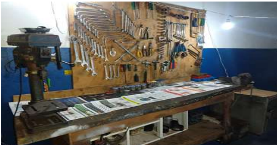
Figura 11 - Bancada de ferramentas após as modificações do programa 5s

Foi realizada uma limpeza na bancada removendo tudo que não tinha mais utilidade, as peças e ferramentas foram limpas, organizadas e armazenadas em seus devidos lugares.