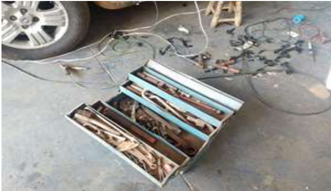
Figura 4 - Caixa de ferramentas antes do programa 5S

As ferramentas são os itens mais importantes dentro da oficina, e devem ser utilizadas e guardadas com zelo, na figura 4 notamos que a caixa de ferramentas está em um local inapropriado, e tem também outras ferramentas que estão jogadas pelo chão, correndo o risco de ser furtada ou causar algum acidente.