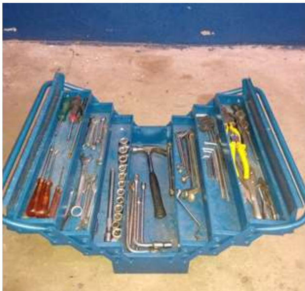
Figura 9 - Caixa de ferramentas após as modificações do programa 5s

A caixa de ferramentas (figura 9) foi limpa, organizada e armazenada em um local apropriado para que o mecânico possa encontrar com facilidade e agilizar o seu trabalho. Colocando no funcionário também a responsabilidade de limpar e guardar as ferramentas no lugar correto.