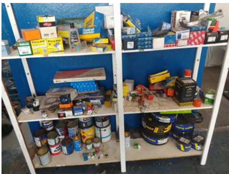
Figura 2 - Prateleira antes do Programa 5S

Na figura 2 mostra como as peças estavam sendo armazenadas de forma incorreta.