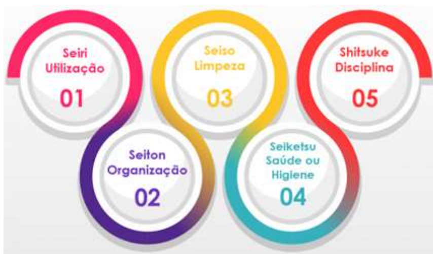
Figura 1 - Programa 5S

A figura 1 mostra os significados das palavras japonesas, de forma mais adequada para a tradução brasileira, utilizando a palavra 'Senso', para designação do termo 5S.