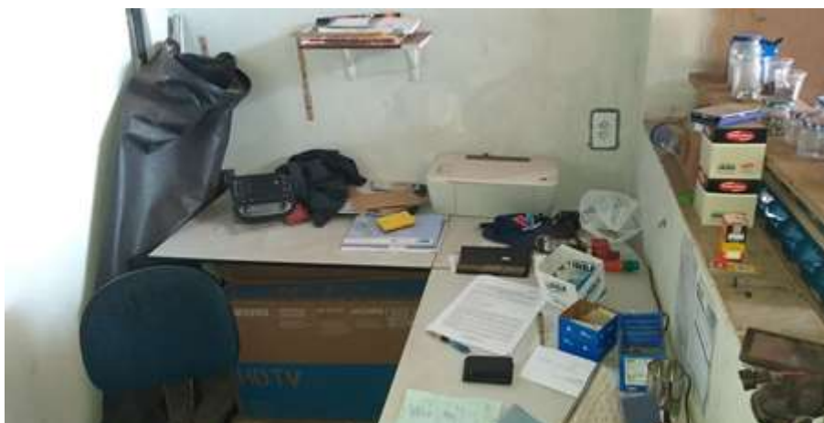
Figura 3 - Escritório antes do programa 5S

Conforme ilustra a figura 3, o escritório possível notar na que existem diversos objetos espalhados pela mesa, alguns de pouca ou nenhuma utilização, tem também peças e equipamentos que deveriam estar armazenados em outro lugar, a limpeza deste local não está adequada.