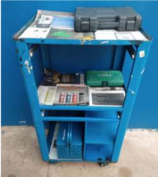
Figura 10 - Carrinho de ferramentas após as modificações do programa 5s