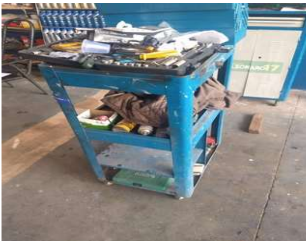
Figura 5 - Carrinho de ferramentas antes do programa 5S

Na figura 5 mostra que o carrinho que tem a função de auxiliar o mecânico a transportar as ferramentas pelos cantos internos e externos da oficina, está com condições de limpeza indevida e sendo usado de forma errada, pois estão armazenando casaco, copo descartável e outros itens que não utilizados na hora do serviço.